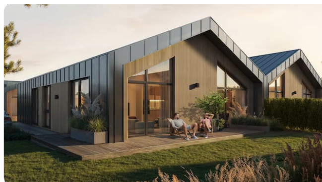
Namas: Žydėjimas / Rasa / Gaiva / Saulėlydis